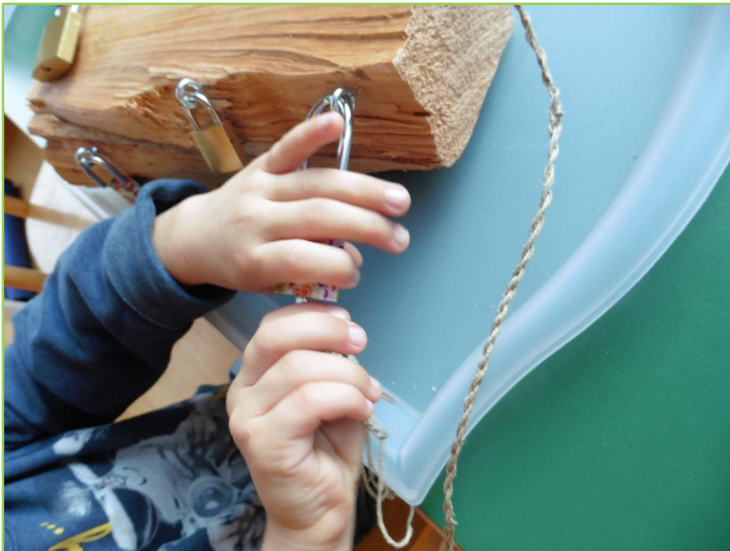
Foto 13 Aktionstablett Vorhängeschlösser

Bauecke und Konstruktionsmaterial sind fixer Bestandteil jeder Kindergartengruppe. Die Auseinandersetzung mit technischen, physikalischen und mathematischen Zusammenhängen finden im Beobachten und Hinterfragen von alltäglichen Situationen und Dingen, wie Werkzeug, Materialien, technischen Geräten, Kräften und Wirkungen, Elementen, Mengen, Mustern und Zahlen statt.