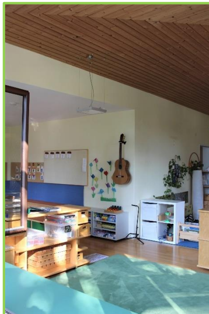
Foto 5 Gruppenraum 'Maus Ida'