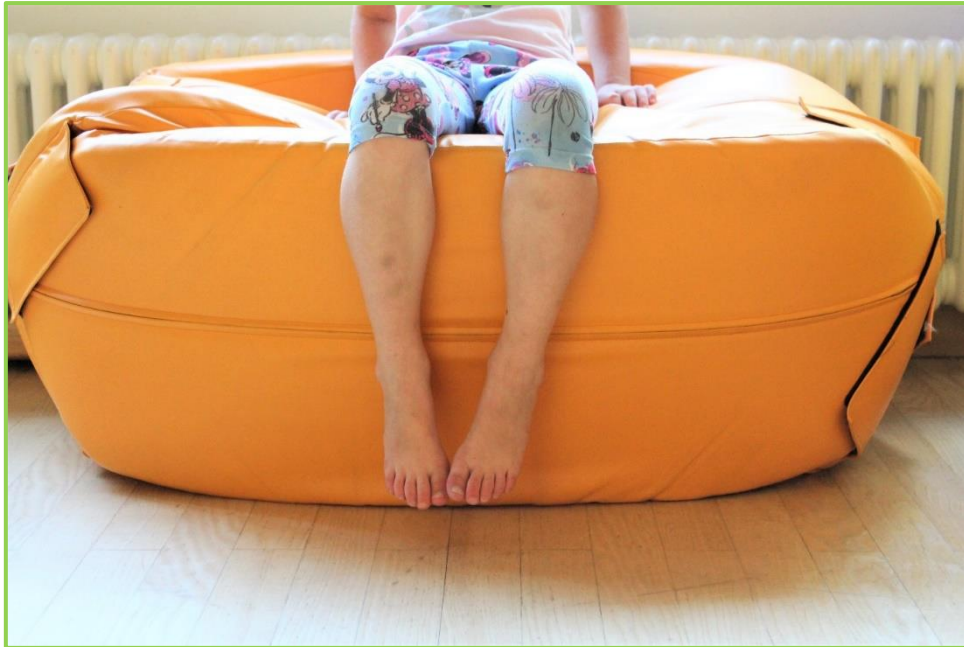
Foto 3 Kinderbeine auf Sitzsack

kreativ, wissbegierig, interessiert und kritisch, sehr hellhörig und feinfühlig, individuell und kooperativ. Sie sind abhängig von Personen, die sie begleiten und lieben - echt und bedingungslos; Deshalb brauchen sie von Menschen, die sie begleiten, Liebe und Zuneigung, Aufmerksamkeit und Zeit, Sicherheit und Geborgenheit, achtsame Führung und Begleitung ihrer Gefühle. Um sich entwickeln zu können, müssen sie „Fehler“ machen und ohne Druck ausprobieren dürfen. Dadurch erleben sie Selbstwirksamkeit und entwickeln Selbstsicherheit und Selbstwertgefühl.