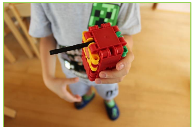
Foto 14 Kind zeigt Bauwerk

Räumlichkeiten, Spiel- und Lernangebote sind so ausgerichtet, dass sie an den Erlebnissen und