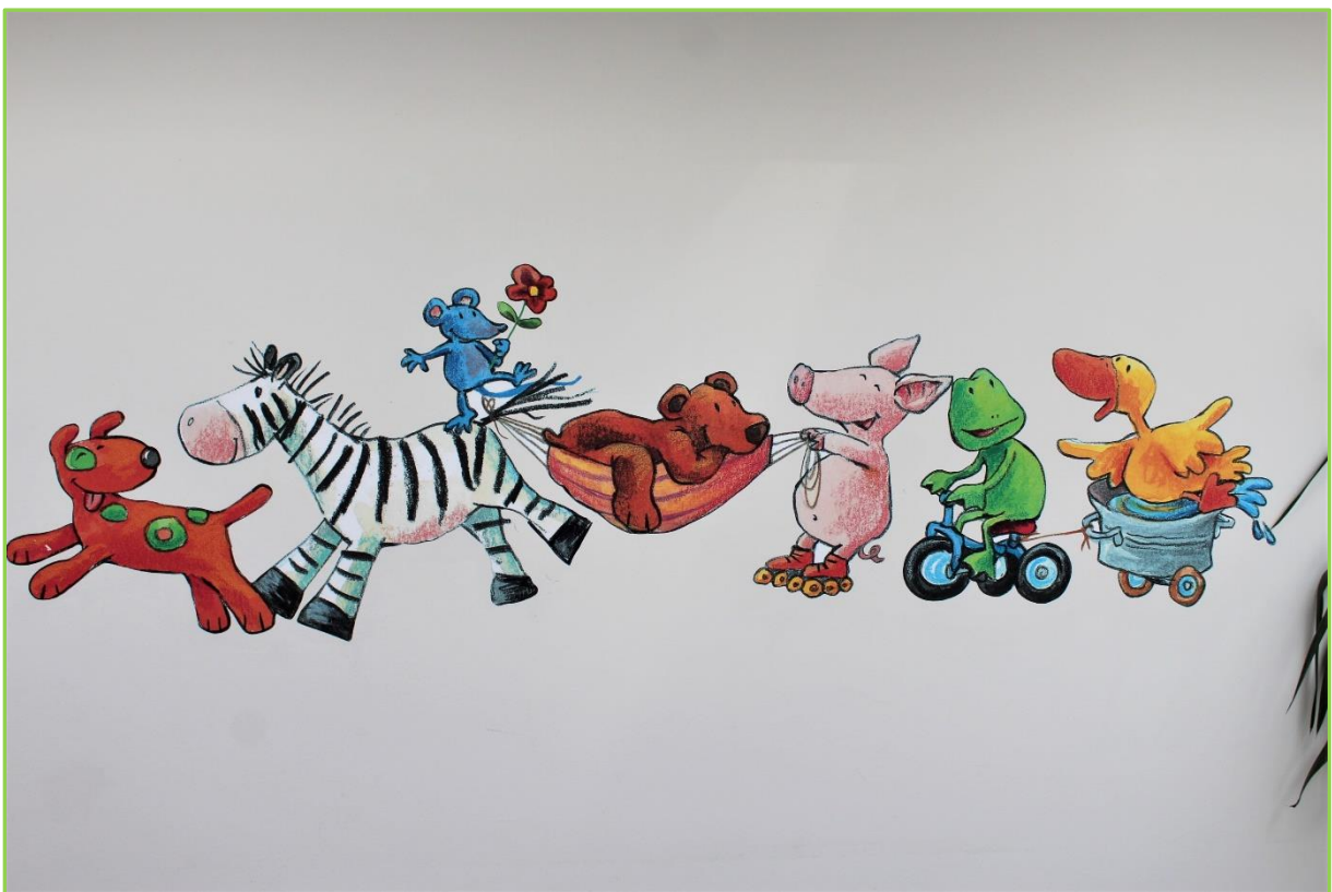
Foto 16 Die lieben Sieben

Eine weitere wichtige Zusammenarbeit findet zwischen der Volksschule und der Kinderwelt Bürmoos statt, um die Transition der Schulanfänger*innen bestmöglich zu begleiten. Es finden Treffen statt, es werden gemeinsame Rituale abgehalten (Adventstunde), die Kindergartenkinder dürfen sich das Schulhaus sowie eine Schulstunde anschauen und die ersten Kontakte mit Lehrerinnen und Lehrern sowie Schüler*innen knüpfen.