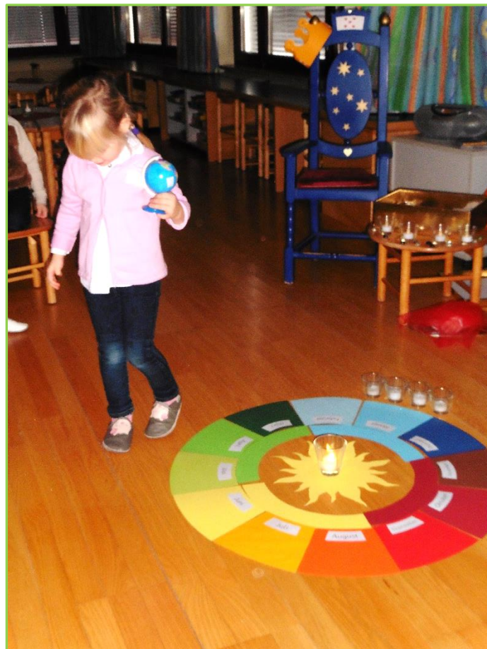
Foto 11 Geburtstagsfeier

Jedes Kind bekommt eine Geburtstagsfeier in der jeweiligen Gruppe. Zu diesem Anlass darf eine Jause bzw. Kuchen für die Gruppe mitgebracht werden. Die Geburtstagsfeier verläuft bei jeder Gruppe und in jedem Kindergartenjahr etwas anders, beinhaltet jedoch immer ein gemeinschaftliches Ritual im Kreis, einen extra Platz für das Geburtstagskind (Thron, besonderer Stuhl, etc. ), besondere Lieder, Geburtstagswünsche aller Kinder, ein kleines Geschenk und eine gemeinsame Geburtstags-Jause. Um den Tag und das Kind zu würdigen, wird eigens dekoriert und dem Kind kommt während der Feierlichkeiten besonders viel Aufmerksamkeit zu. Durch Entscheidungen, die es im Festverlauf treffen darf (Lieder, Farben, Sitznachbarn, Spiele etc.) kann das Geburtstagskind seine Feier mitgestalten. Für Kinder, die nicht gerne im Mittelpunkt stehen oder solche Festlichkeiten eher Unbehagen bereiten, wird der Verlauf behutsam angepasst. Das gesamte Fest dauert ca. eine Stunde des Vormittagsprogramm.