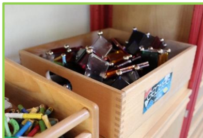
Foto 9 Maanetbausteine