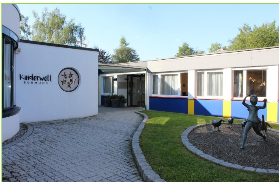
Foto 2 Eingangsbereich außen