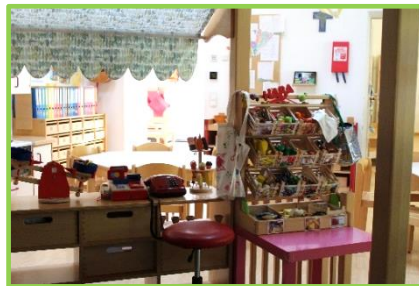
Foto 10 Verkaufsladen