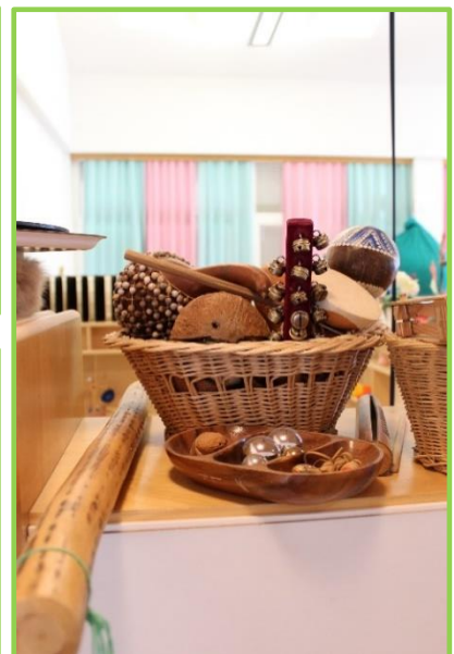
Foto 8 Musikinstrumente