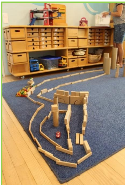
Foto 7 Holzbausteine