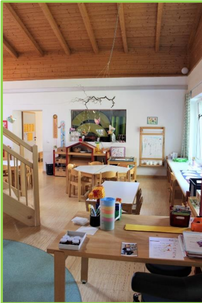
Foto 6 Gruppenraum 'Hund Henri'