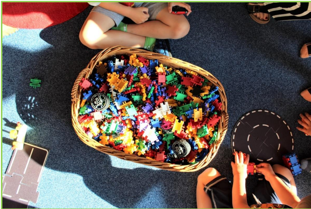
Foto 12 Konstruktionsmaterial

Die sechs Bildungsbereiche des Bildungsrahmenplan gelten in der Kinderwelt Bürmoos als die bildungspraktische Orientierung für Beobachtung, Vorbereitung der Lernumgebung und Dokumentation. Pädagog*innen arbeiten im Bewusstsein um ihre Vorbildfunktion für die Kinder und sind daher stets bemüht, den Prinzipien entsprechend zu handeln – dennoch dürfen auch hier Fehler passieren. Bei Unklarheiten gehen die Pädagog*innen gemeinsam mit den Kindern in einen Prozess der Informationsbeschaffung und kommen so offenen Fragen auf die Spur. Im Folgenden wird auf jeden Bereich hinsichtlich dessen Umsetzung in der Kinderwelt Bürmoos eingegangen.